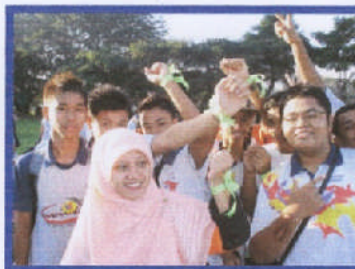
Aksi pelajar bersama guru , memang sporting!