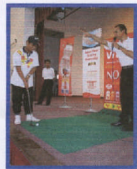
Golf atas pentas, ingat senang...