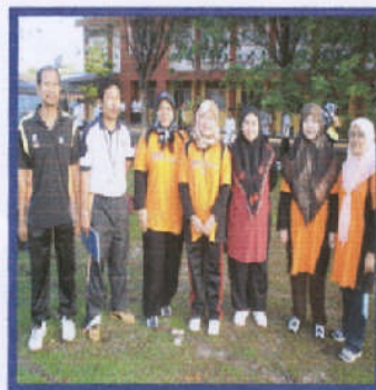
Guru juga turut sama

Buat pertama kali SMK Seri Serdang mengadakan senamrobik perdana. Semua warga sekolah melibatkan diri dalam aktiviti ini. Di samping itu terdapat acara permainan oleh pihak vitagen yang turut menyumbang hadiah.